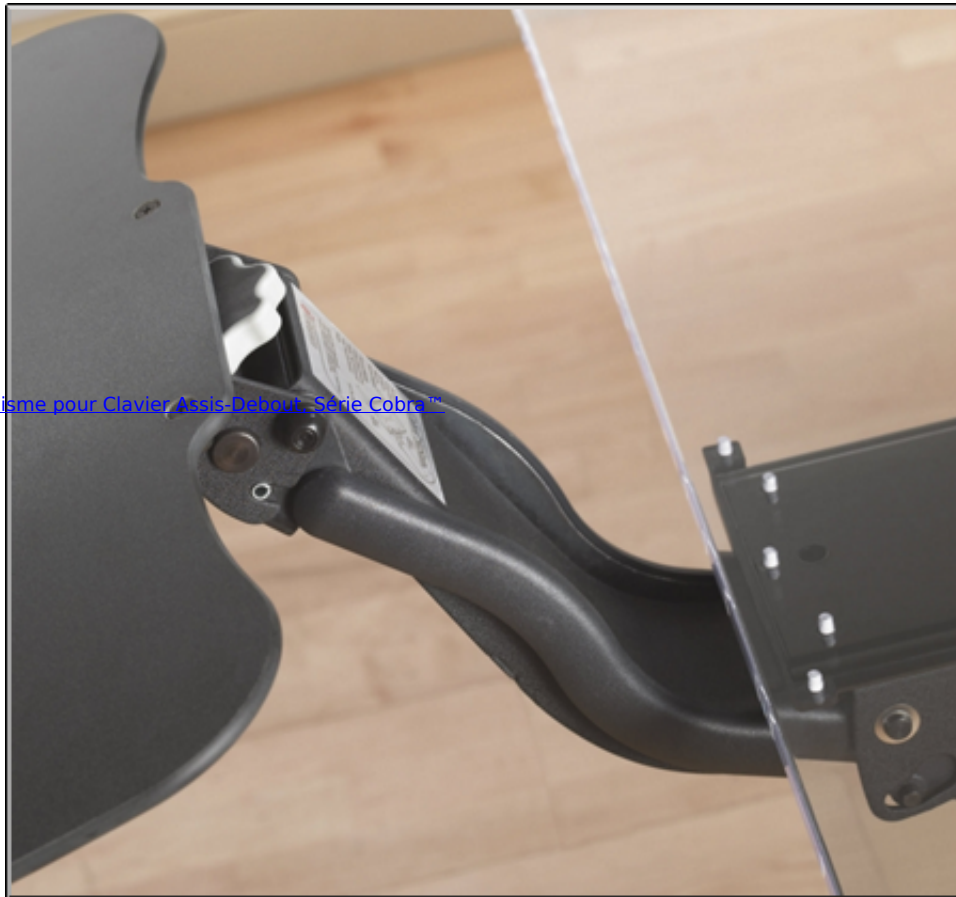
Mécanisme pour Clavier Assis-Debout, Série Cobra™

Pour choisir un plateau à clavier, CLIQUEZ ICI